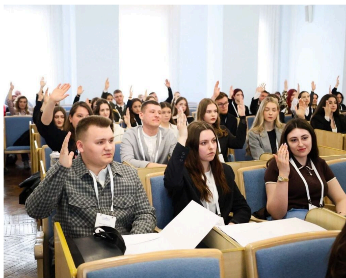
Відділ навчально-виховної роботи

Загальні питання: centr@khnmu.edu.ua Подача новин та анонсів: press@khnmu.edu.ua