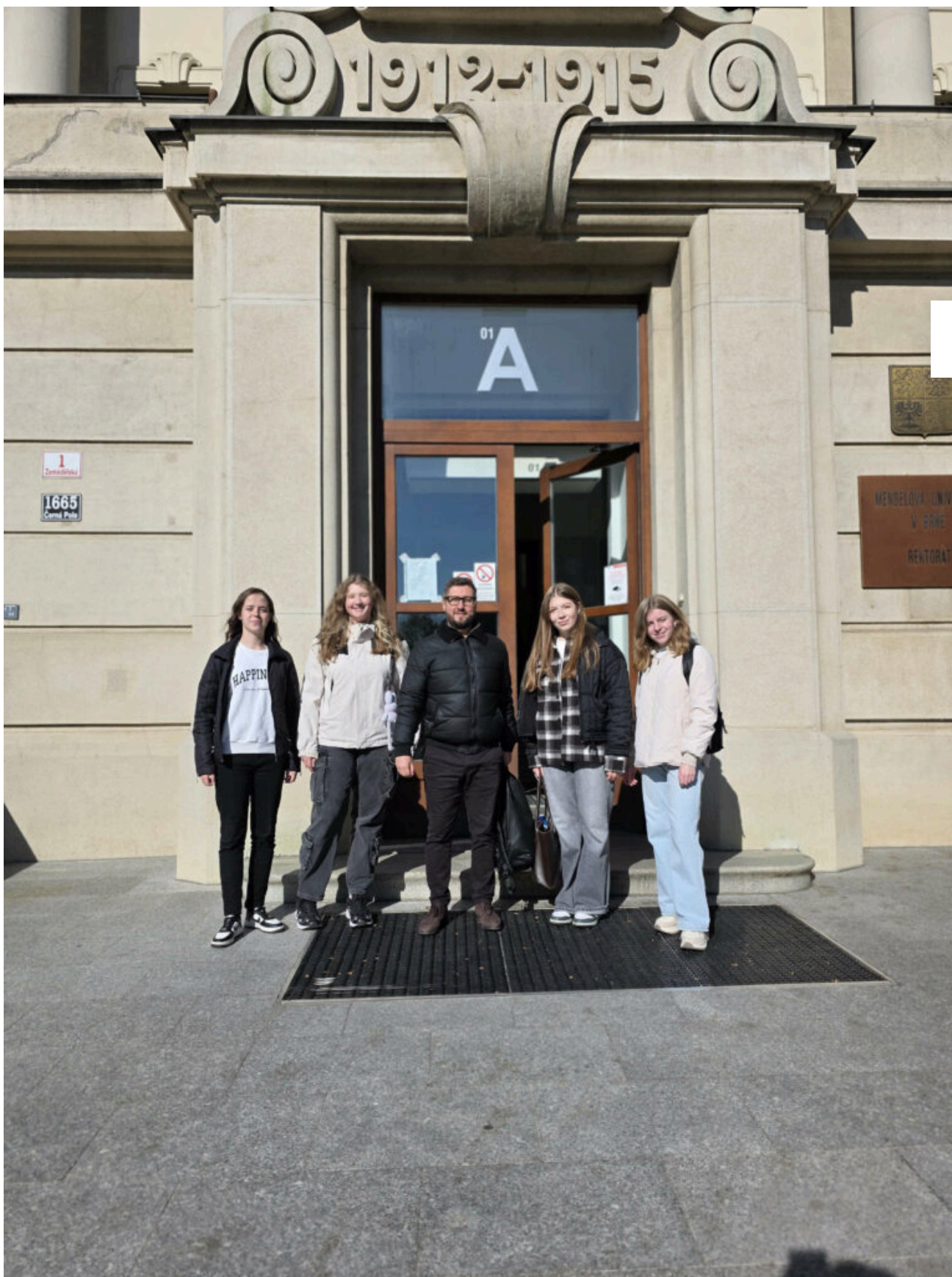
Кафедра комп'ютерної інженерії та інформаційних систем