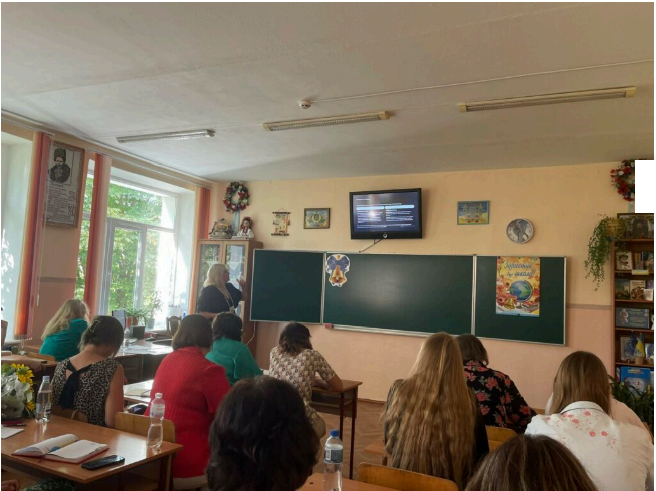
Інформація кафедри української філології

Адже розвиток учителя – це розвиток учня, а значить і майбутнє нашої країни.