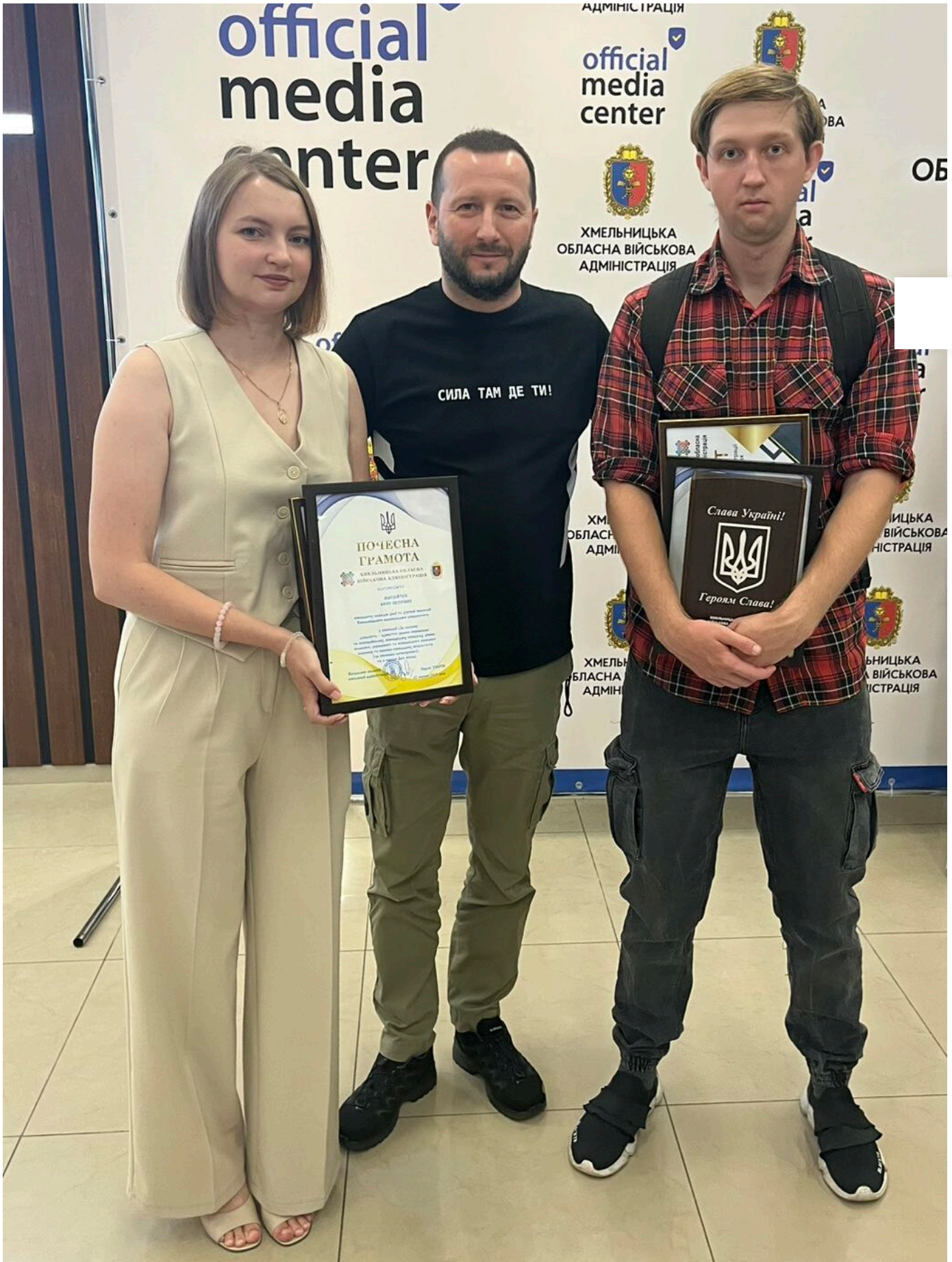
Відділ навчально-виховної роботи