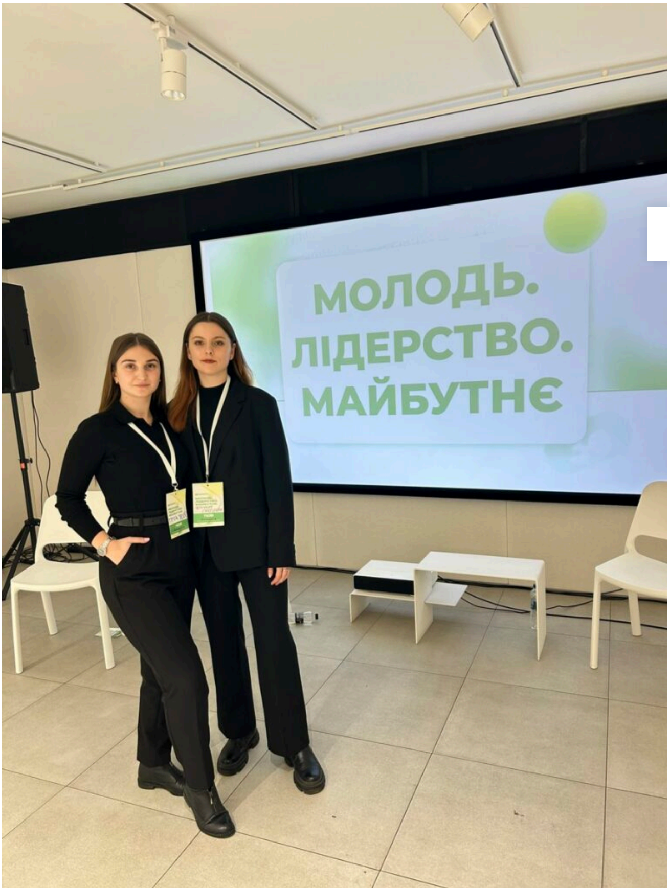
Відділ навчально-виховної роботи