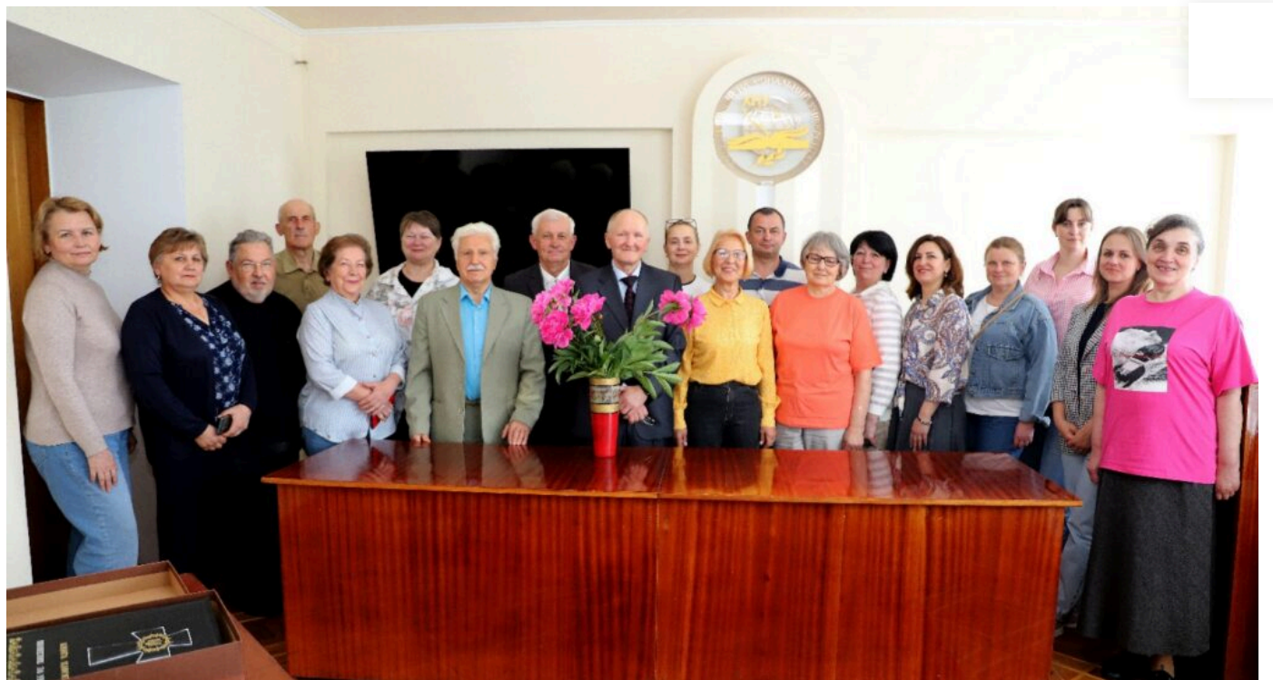
Рада ветеранів Хмельницького національного університету

На завершення конференції – фото на згадку!