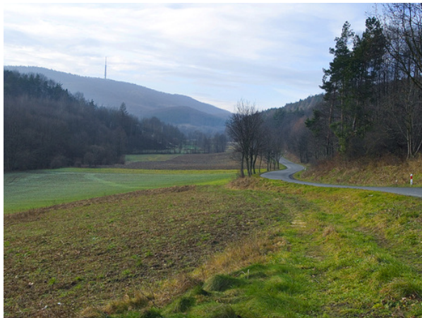
Дорогою на Кросно

А потім вирушили до Політехнічного інституту чудового міста Кросно, що розташувалося у центрі мальовничого гірського масиву Бескиди Низькі.