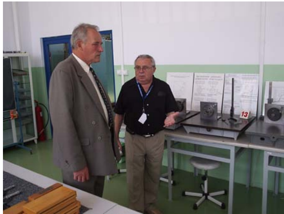
Лабораторія метрології та прецизійного вимірювання професора Володимира Любімова в Політехніці Жешовській

Побували ми у Жешуві в гостях у професора Володимира Любімова, відвідали його лабораторію та кафедру.