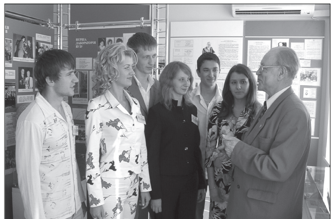
З кращими представниками студентської ради університету