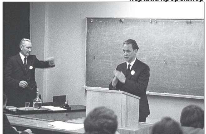
У Мічиганському університеті(1962-1966)