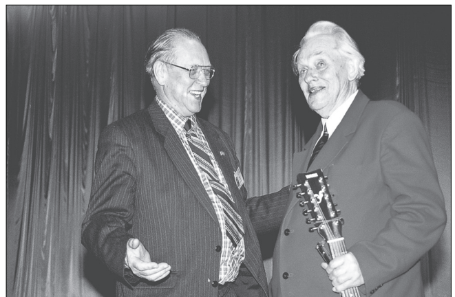
З відомим режисером, композитором і співаком А.А. Горчинським