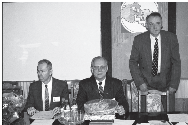
На засіданні вченої ради Технологічного університету Поділля